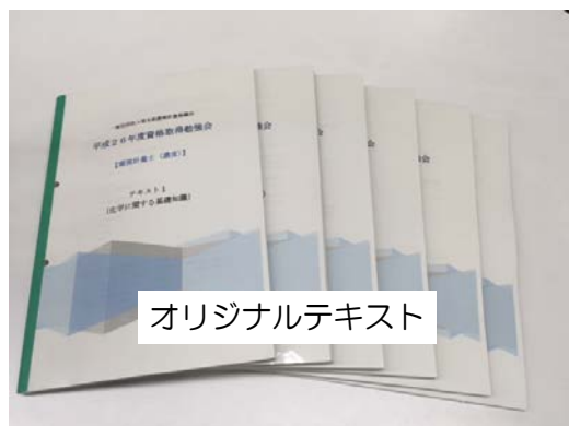
オリジナルテキスト

平成28年度は、過去2年と同様に「環境計量士（濃度）」を対象に資格試験勉強会を開催しますので、是非ともご参加ください。